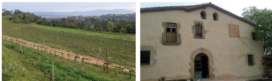
FIGURA 3. Can Calopa de Dalt, conreu de vinya a Collserola i masia del segle XVI